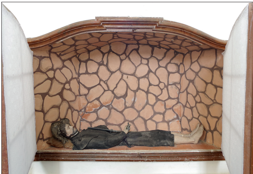
Hrob sv. Františka Xaverského v Knínících u Telče, 18. století.