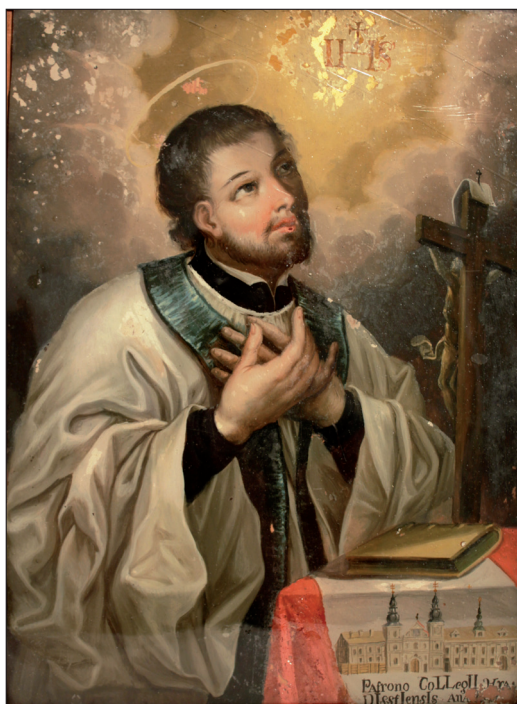
Podmalba na skle s vyobrazením sv. Františka Xaverského s jezuitskou kolejí v Uherském Hradišti, Morava, 18. století. Muzeum Vysočiny Třebíč – Muzeum řemesel Moravské Budějovice, bez sign.