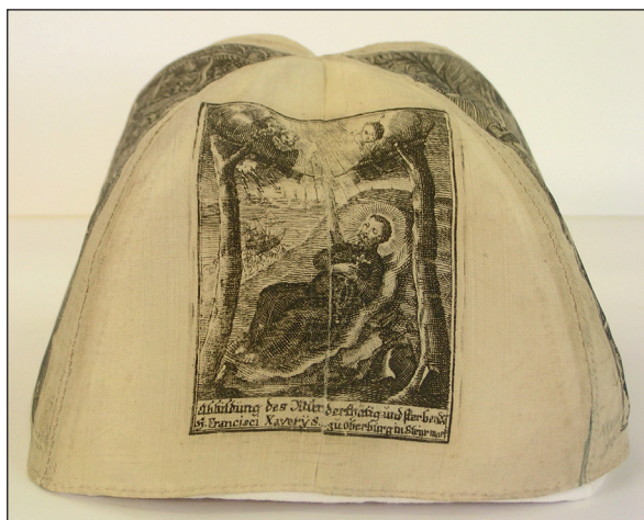
Loretánský čepěček s vyobrazením sv. Františka Xaverského, Rakousko, konec 18. století. Muzeum Jindřichohradecka, sign. N 1913.