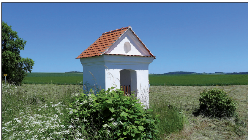
Kaplička – druhé zastavení křížové cesty nedaleko Knínic u Telče.