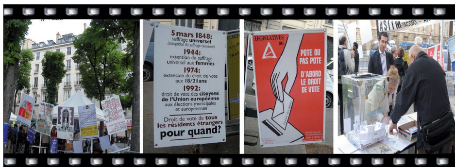
Obr. 1: Happening na podporu volebního práva cizinců ze zemí mimo EU u místních voleb (20. května 2008)

Nicméně bez ohledu na proklamace nově zvoleného francouzského prezidenta François Hollande (ve funkci od 15. 5. 2012), že udělá vše potřebné pro to, aby cizinci mohli využít svého práva volit v komunálních volbách na jaře roku 2014 (LDH 2012), zákon doposud 8 nevstoupil v platnost a volby na jaře roku 2014 se odehrály podle dosavadních pravidel.