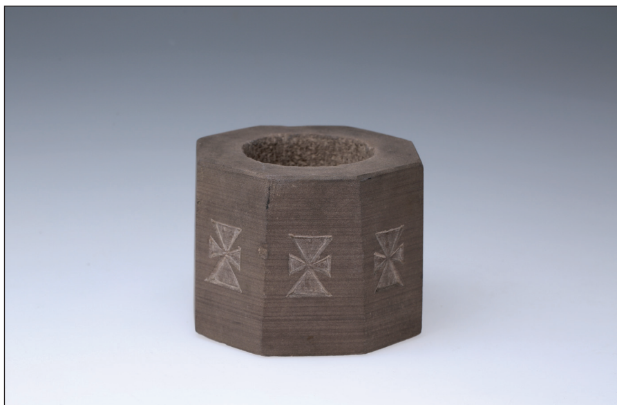
Obr. 7 Schránka na kadidlo z růžového pískovce. Poslední čtvrtina 19. století. Ukrajina, Ternopilský kraj, okres Terebovla (západní Podolí). H4-NS-1235.