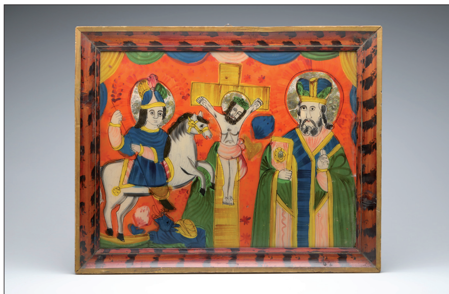
Obr. 4 Obraz malovaný na skle „Sv. Jiří Drakobijec, Ukřižování a Sv. Mikuláš Divotvůrce“ v dřevěném lakovaném rámu. Druhá polovina 19. století, Ukrajina, Haličské Huculsko. H4-NS-1134.