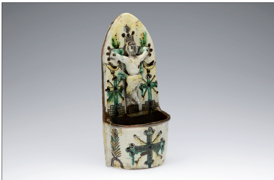
Obr. 6 Keramická glazovaná kropenka kropylnycja s rytím a malbou. Poslední čtvrtina 19. století, Ukrajina, Ivano-Frankivský kraj, okres Kosiv (Haličské Huculsko). H4-NS-1786.