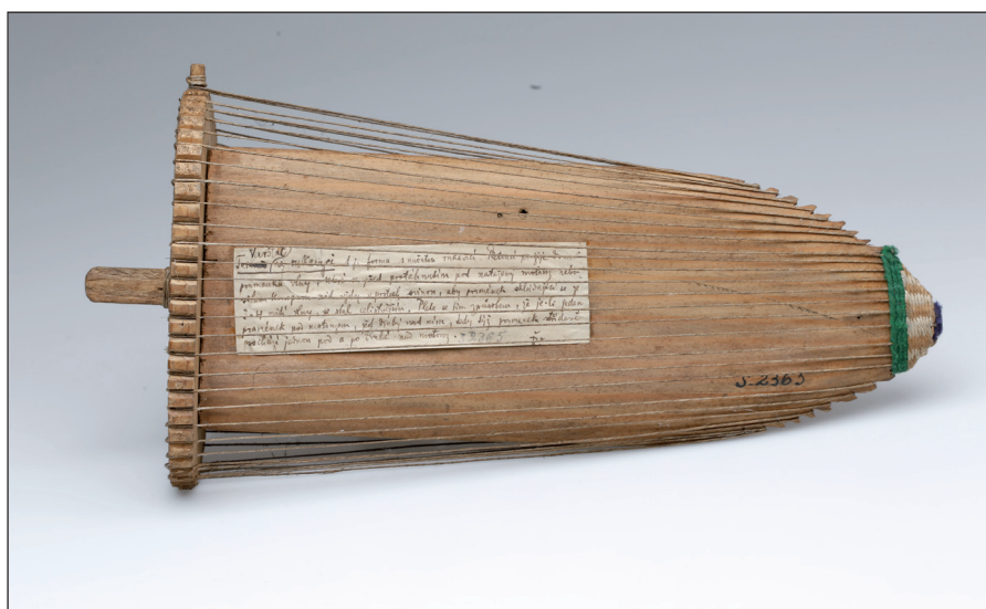
Obr. 2 Dřevěný stávek na pletení rukavic s konopnými nitěmi. Poslední čtvrtina 19. století, Ukrajina, Haličské Huculsko. H4-NS-2365.