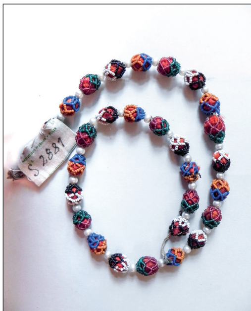
Obr. 1 Náhrdelník – obpletene monysto z drobných korálek – biseru navlékaných na splétaných nitích. 19. století, Ukrajina, Ivano-Frankivský kraj, okres Horodenka (Pokuttá). H4-NS-2881.