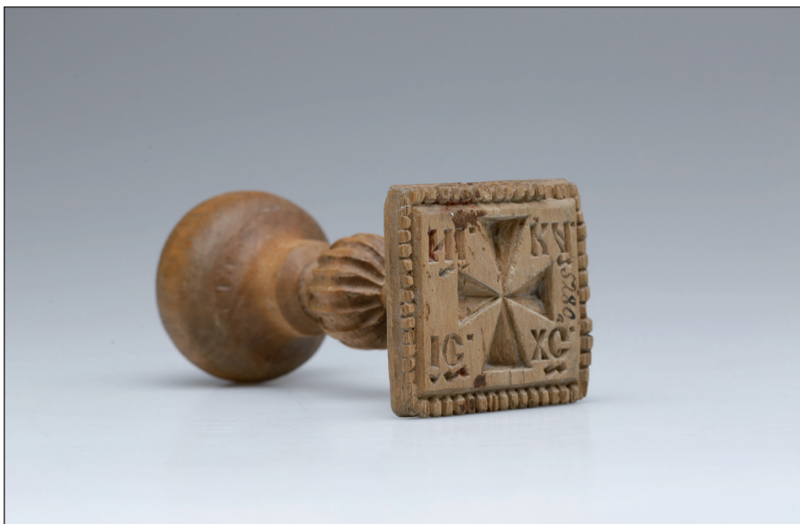
Obr. 5 Dřevěné vyřezávané pečtidlo – znamenyk na liturgické chleby – proskury . Poslední čtvrtina 19. století, Ukrajina, Ternopilský kraj, okres Terebovla, obec Strusiv (západní Podolí). H4-NS-1191.