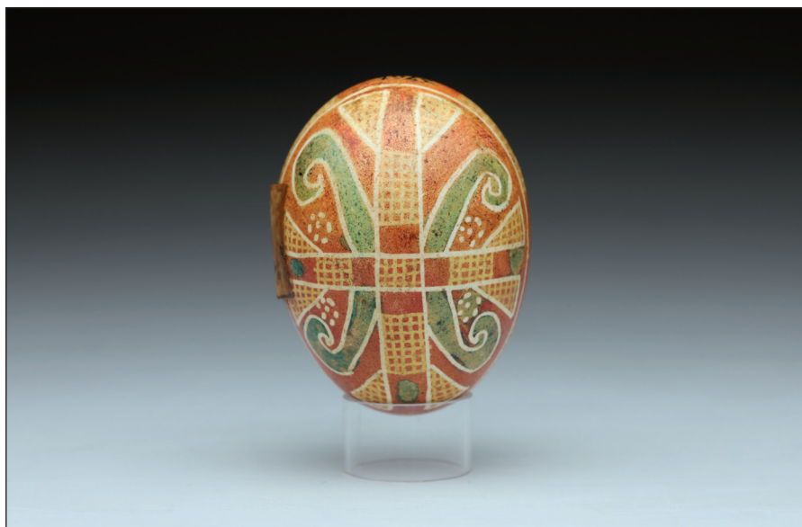
Obr. 3 Velikonoční kraslice – pysanka z roku 1895; kuřecí vejce, přírodní barviva, vosková technika. Ukrajina, Ivano-Frankivský kraj, okres Kolomyja, obec Zaluččja nad Prutom (Pokuttá). H4-NS-3761.